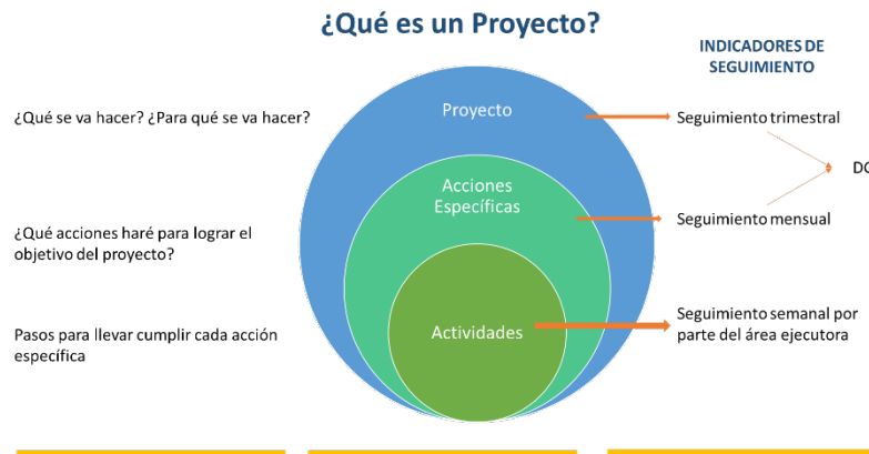
Ilustración 2. Monitoreo y Evaluación de los resultados

y líneas de acción que se establezcan en el Plan Anual. Se especificó la temporalidad con la que se medirán los resultados, así como la jerarquía en la estructura de la planeación.